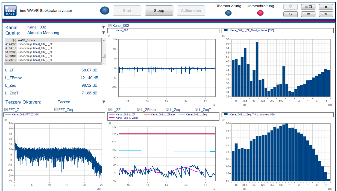
Abb. 2: imc Wave Spektralanalysator