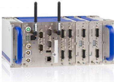
Abb. 1: imc CRONOSflex

Mit imc CRONOSflex stellt imc ein modulares Baukastensystem zur Verfügung, das dem Anwender ein bisher unerreichtes Maß an Flexibilität bei der Zusammenstellung eines Messsystems gibt. Das System erfordert keinerlei Baugruppenträger oder Rahmen. Sowohl Basis-Einheit, als auch die modularen Messmodule (Verstärker bzw. Konditionierer) besitzen eigenständige Gehäuse: Diese können entweder mittels eines robusten „Klick“-Mechanismus auf einfache Weise zu einem System verbunden werden oder alternativ über ein Standard Netzwerk-Kabel räumlich verteilt genutzt werden. Erfassen Sie synchron verschiedenste Sensoren und Signale, analoge und digitale Daten, Feldbusse, Audio- oder Videodaten.