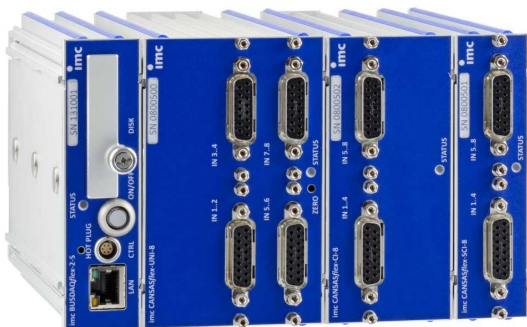
imc CANSASflex Module als Block (Klick-Verbindung) mit imc BUSDAQflex Logger (links)