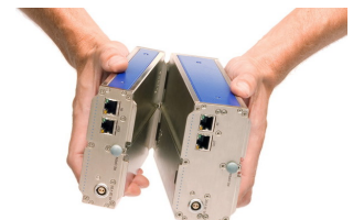
imc Klick Mechanismus

Das so gebildete Messsystem wiederum ist über eine gewöhnliche Ethernet Verbindung (LAN / WLAN) mit einem PC zu steuern, der als Konfigurator und Messdatensenke fungiert.